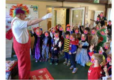
Eindrücke vom bunten Treiben im Kinderhaus