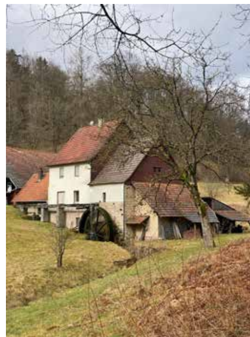
Unterwegs eine alte Mühle

Am 1. März unternahmen unsere Wanderer eine Wanderung im Spessart. Sie fuhren mit dem Zug nach Heigenbrücken und wanderten über Jakobsthal zum Engländer-Haus, wo sie zu einer Rast einkehrten.