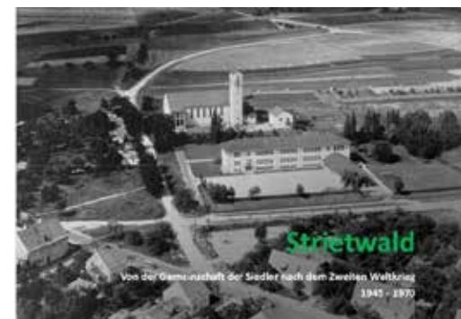
Chronik II erscheint im Mai

Die dynamische Entwicklung der Strietwaldsiedlung nach dem Krieg ist in einer neuen Chronik „Strietwald – Von der Gemeinschaft der Siedler nach dem 2. Weltkrieg 1945 – 1970“ dokumentiert, die am 2. Mai erscheinen wird.