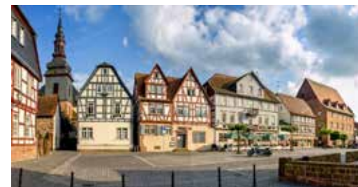
Siedlers Ausflugsziel: Büdingen