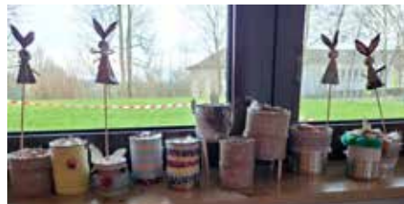
Die kreativen Ergebnisse