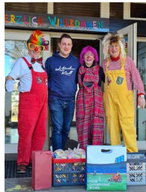
Süßigkeiten für die Kinder dürfen nicht fehlen

Wunderschön die Begeisterung und Freude bei den Kindern. Eine Polonaise durch den Kindergarten bei schöner Musik, der berühmten „Rakete“ des Kinderfaschings und der Gesang der Kinder machte allen viel Freude.