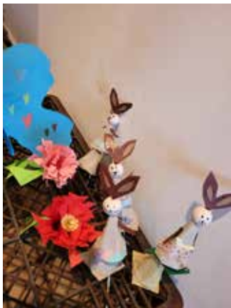
Schöne Oster-Basteleien

Am 26.4. geht's weiter mit Überraschungen für Mutter- und Vatertag. Wir hoffen, dass wir Euch alle wieder begrüßen können.