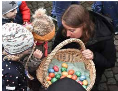
Bunter Ostereier für die Kleinen