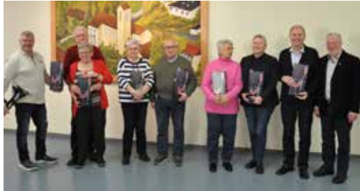
Ehrung zu 25 Jahren Mitgliedschaft