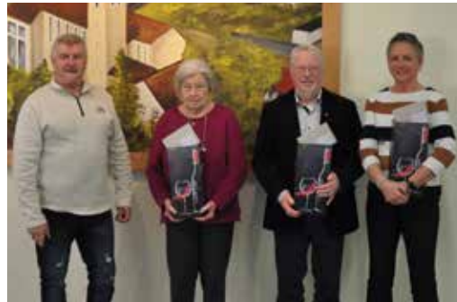
Ehrung zu 40 Jahren Mitgliedschaft