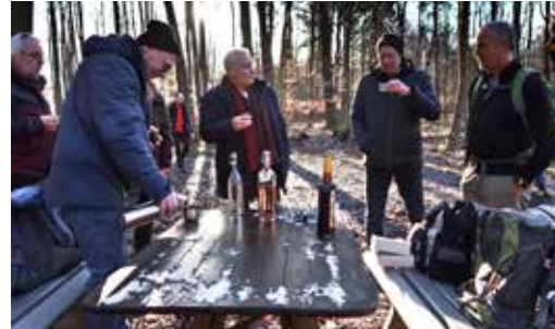
Trinkpause am Pfaffenwaldhäuschen

suppe, von ihm und Andreas Neumann zubereitet, wartete auf uns, Getränke standen bereit. Gut 30 Kühe ließen sich beim Fressen und Kauen kaum stören. Nur die 20 Hühner in einem ehemaligen Bauwagen gackerten ein wenig und beobachteten uns neugierig.