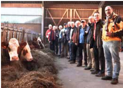
Besuch im Kuhstall

Pünktlich um 14 Uhr ging es los. Die Sonne und der blaue Himmel ließen die frostige Temperatur erträglich erscheinen. Bald schon sollte es den Wanderern recht warm werden. Denn mit strammem Schritt ging es hoch zum Nordfriedhof, quer durch den Strietwald ins Steinbachtal, am Jahnfelsen vorbei, wo vor fast 100 Jahren von Aschaffenburger Turnern anlässlich des 150. Geburtstages von Turnvater Jahn eine Bronzetafel angebracht worden war, und dann immer bergauf. Eine erste Trinkpause gegen den Durst und gegen die Kälte wurde am Pfaffenwaldhäuschen eingelegt, das einst von der königlich-bayerischen Forstuniversität errichtet wurde. Ludwig Thoma, von dem die berühmten ‚Lausbubengeschichten‘ stammen, soll sich hier Ende des 19. Jahrhundert zurückgezogen und erste literarische Schritte versucht haben.