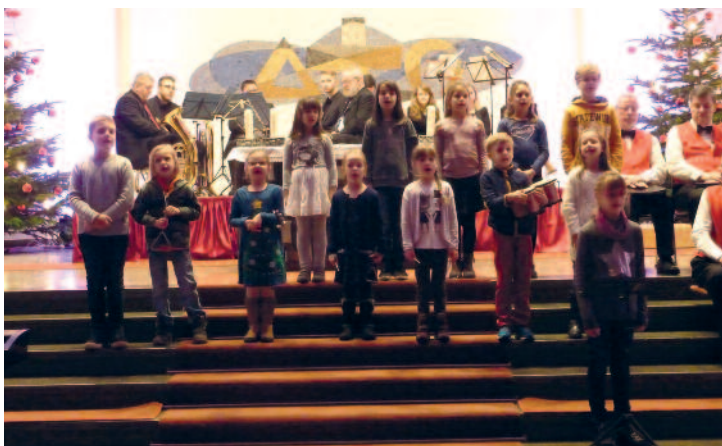
Der Kinderchor St. Konrad beim Advents-Konzert

Die Wanderer beendeten das Jahr 2016 am 29. Dezember mit einer tollen Tour über Johannesberg nach Unterafferbach. Im Gasthaus „Zur Post“ wurde zur Mittagsrast eingekehrt. Danach wanderten wir nach Hösbach ins Gasthaus „Zur Traube“, bevor wir mit dem Bus in den Strietwald zurückfuhren. Weil es so schön war, kehrten wir nochmals im SG-Sportheim ein. Der Jahresabschluss war bestens gelungen. Die erste kleinere Wanderung im neuen Jahr ließ nicht lange auf sich warten.