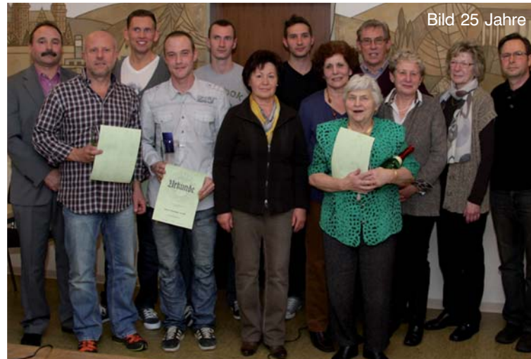
Bild 25 Jahre