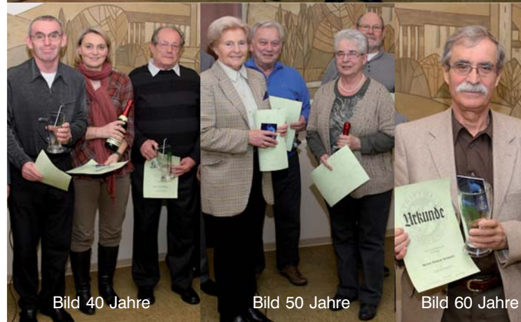
Bild 40 Jahre